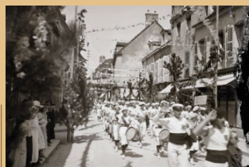
Défilé des sociétés de gymnastique, Jules Misserey