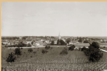
Vue générale de Nuits-Saint-Georges, Jules Misserey

Chaque partie de l'exposition est agrémentée d'une mosaïque de photographies contemporaines. Cette promenade entre clichés anciens et actuels permet d'apprécier l'évolution de la ville.